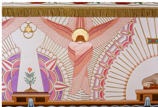
Antependium der Kapelle des Linzer Priesterseminars, 1900-1920 (Ausschnitt,)

Di., 24. Oktober 2023, 18:00 Uhr online via Zoom